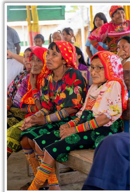
Guna-Frauen erwarten uns

Wir werden von den Bewohnern der Insel Tigre schon erwartet, als wir wie vereinbart mit zwei Kisten voll Lesebrillen ankommen. In einem Dorf, wo nur wenige Menschen Geld verdienen - weil sie das nötigste zum Leben aus dem Urwald und aus dem Meer holen - sind Lesebrillen ein Luxus.