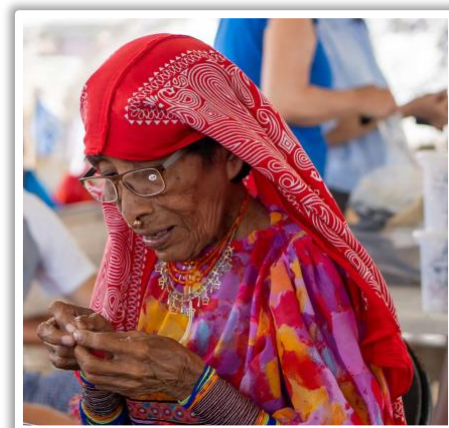
Mit der neuen Brille kann sie wieder nähen

In diesem sehr ursprünglichen Dorf beginnen die Frauen schon sehr früh, Molasses zu sticken. Ältere Frauen sprechen meist nur die Guna-Sprache und können nicht Spanisch sprechen - und daher auch nicht lesen. Wir testen die Sehstärke der Lesebrillen, indem die Frauen einen Faden in eine Nähnadel einfädeln. Mit den neuen Brillen können sie weiterhin mit Präzision die Molasses sticken.