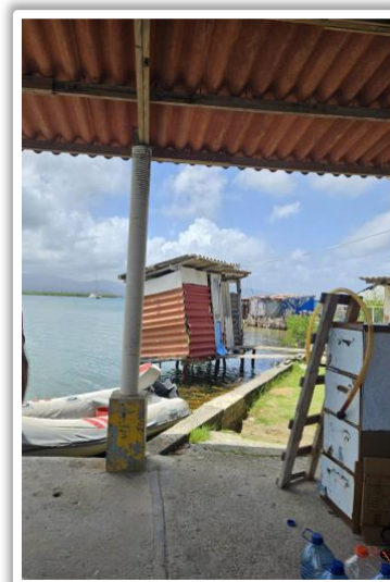
Außentoilette in Nargana