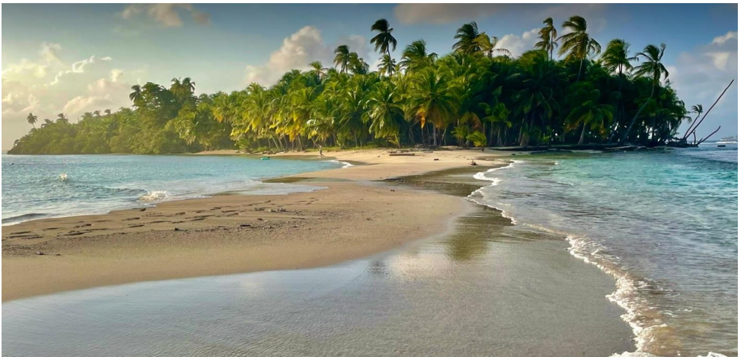
Foto oben: Das mittlerweile teuerste Segelgebiet auf diesem Planeten - wir werden es verlassen.

Es ist purere Luxus hier zu sein - im wohl teuersten Segelgebiet der Welt , und wir genießen die letzten Monate. Per Januar 2026 wurden die San Blas Inseln hinsichtlich der lokalen Abgaben fünfmal so teuer wie die Bahamas - und bisher galten letztere als eines der teuersten Gebiete auf diesem Planeten. Die Kosten, die wir als Folge dessen an unsere Mitsegler weitergeben müssten, würden zu „ schamlosen Preisen “ führen.