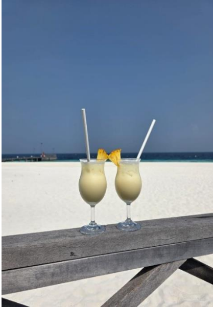
Foto oben: ... was machen wir? Wir machen uns keine Sorgen und segeln in die BAJA CALIFORNIA.

Eine einzige Entscheidung im Jahr 1999 führte das Land in den Ruin . Es war ein Volksentscheid, bei dem ein ausgezeichnete Redner (Hugo Chávez) mit einfachen Versprechen vor allem die armen Menschen überzeugte, ihn zu wählen. Ich wunderte mich sehr über diese Entscheidung , denn nur von dem Versprechen, Geld zu verteilen, kann kein Staat leben. Innerhalb weniger Jahre waren die Supermärkte leer , die Landeswährung, der Bolivar Fuerte (BF), sank im