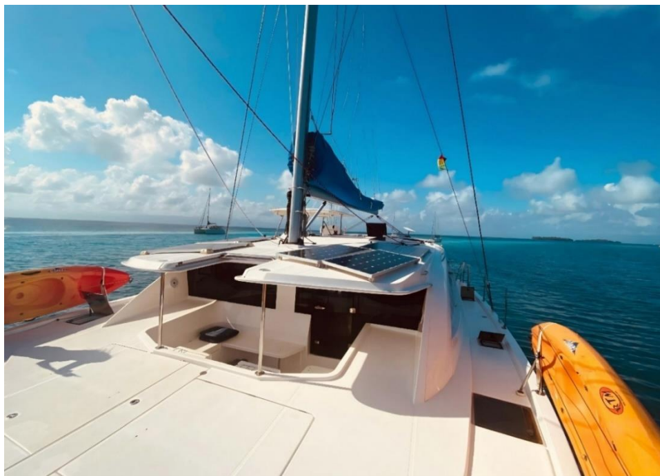
Foto oben: Wir genießen auf JONATHAN die letzten Monate in den San Blas Inseln. beschlossen. Rechts habe ich den Beschluss abgelichtet, der 3 Kategorien vorsieht.

1. Will man mit seinem (nicht in Panama registrierten Boot) mit 2 bis maximal 5 Personen – Familie oder Gäste - segeln, werden 3.000 USD (Jahresgebühr) verlangt, zusätzlich 100 USD pro Person und Monat. Dazu kommen noch die 200 USD der AMP (Autoridad Marítima - oberste Schifffahrtsbehörde Panamas) für das „Permiso de Navegación“, zusammen also für einen Monat 3.700 USD , wenn man mit 5 Personen segeln möchte.