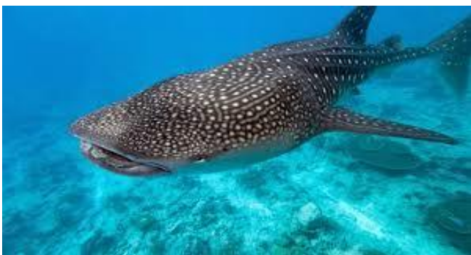
Foto oben: An unserem nächsten Ziel, der BAJA CALIFORNIA, gibt es auch Walhaie zu sehen.

von Puerto la Cruz überfallen, angeschossen und schwer verletzt wurde. Betriebe wurden enteignet und an politische Günstlinge vergeben. Dummerweise wurden auch viele US- Betriebe, die in Venezuelas Ölindustrie Milliarden USD investiert hatten, enteignet. Nachfolger von Hugo Chávez wurde Nicolas Maduro. Er führte diesen Kurs weiter. Der unglaubliche Reichtum des Landes (Tourismus, Erdöl, seltene Erden, Gold...) wurde von einer Elite eingesackt und nichts an die Bevölkerung weitergegeben . Soweit meine Beobachtungen. Es war Zeit, Venezuela zu verlassen.