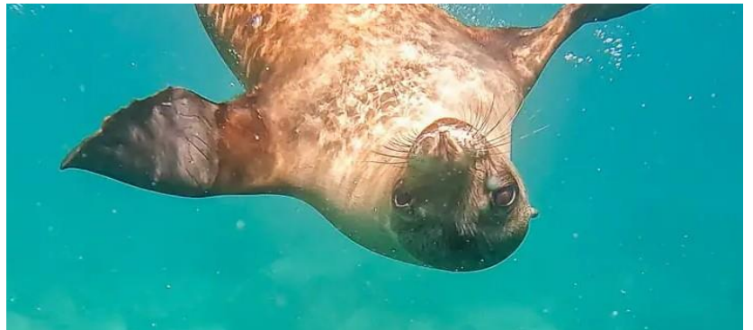
Foto oben: Es ist Zeit, nach MEXIKO zu segeln, wo es Seelöwen, Delfine, Wale, ... gibt.

Eine einzige Entscheidung im Jahr 1999 führte das Land in den Ruin . Es war ein Volksentscheid, bei dem ein ausgezeichnete Redner (Hugo Chávez) mit einfachen Versprechen vor allem die armen Menschen überzeugte, ihn zu wählen. Ich wunderte mich sehr über diese Entscheidung , denn nur von dem Versprechen, Geld zu verteilen, kann kein Staat leben. Innerhalb weniger Jahre waren die Supermärkte leer , die Landeswährung, der Bolivar Fuerte (BF), sank im