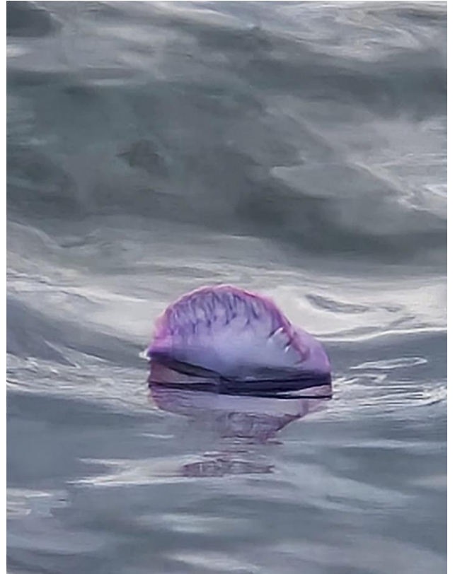
Foto oben: Trotz ihrer faszinierenden Schönheit: Die „Portugiesische Galeere“ ist eines der giftigsten Meereslebewesen überhaupt, seit Februar „segeln“ immer mehr davon in den San Blas Inseln.

Die Bade- und Schnorchel-Freuden von Seglern waren heuer aber durch eine weitere Tücke beeinträchtigt: Portugiesische Galeeren traten gehäuft auf . Die portugiesische Galeere ist keine echte Qualle, sondern eines der faszinierendsten und zugleich gefährlichsten Meereslebewesen überhaupt . Diese „Quallenart“ ist eigentlich kein Lebewesen, sondern ein Staatsorganismus von vielen, hoch spezialisierten Einzellebewesen, die wie ein einziges Wesen funktionieren.