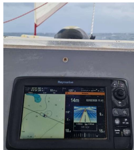
Foto oben: Bei starkem Wind, hoher Welle und entsprechender Bootsbeugung ist die Grenze die Belastbarkeit der Crew, nicht die Leistungsfähigkeit des Bootes. Über 9 Knoten im Schnitt entspricht einem Etmal von etwa 220 Meilen. Dazu muss das Schiff aber auch Spitzengeschwindigkeiten von 15 Knoten segeln können.

Der Grund, warum wir uns bei diesen Wetterbedingungen entschlossen, dennoch den geschützten Ankerplatz zu verlassen, war, dass wir einen der Orte aufsuchen wollten, in dem es noch keinen Tourismus gibt . Ukupseni liegt in den San Blas Inseln so weit östlich, dass es noch keinen Internetempfang gibt, und daher finden sich dort selten Segelboote ein (Internet ist aber geplant, einen Sendemast gibt es bereits).