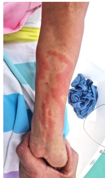
Foto rechts: Der Arm wurde von einem Tentakel einer Portugiesischen Galeere gestreift.

Gegenmittel: NUR MIT ESSIG SPÜLEN - NICHT MIT FRISCHWASSER. NICHT ABTUPFEN, sondern die Fäden mit einer Pinzette von der Haut ablösen und die einzelnen Minipfeile mit einer Pinzette aus der Haut ziehen. Antihistamin einnehmen, bei starken „Verbrennungen“ Transport in die nächste Krankenstation.