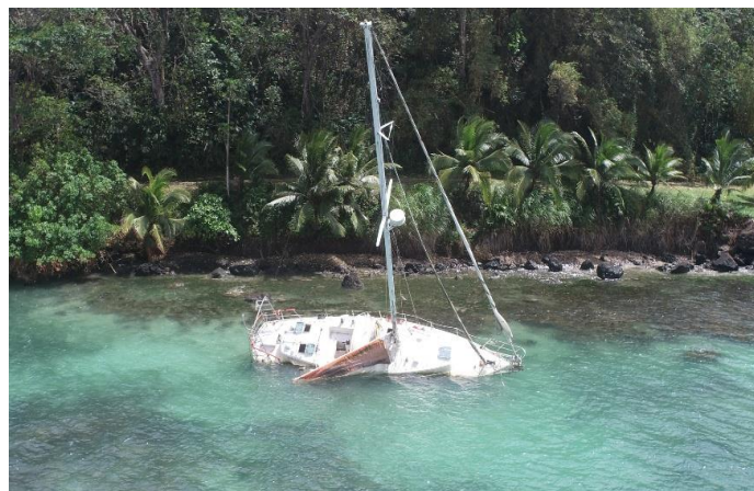
Foto oben: Starkwindopfer: Die Mooringleine brach - Totalverlust.

Manche im Segelrevier der San Blas Inseln haben die Wettersituation offenbar unterschätzt . So wurden Boote aufs Riff gedrückt , zwei Motorboote sanken wegen der hohen Welle. Der Starkwind forderte ein weiteres Boot, das an einer Mooring hing. Die Leine brach , das Boot trieb aufs Riff und ist offenbar ein Totalverlust. Von so einem Fall berichtete ich schon einmal in der Flaschenpost Nr. 145 vom Mai 2021. Das Problem ist, dass Leute Moorings anbringen, ohne sich Gedanken um die regelmäßige Wartung zu machen. Die Moorings werden dann vermietet, der Mieter verlässt sich darauf, dass diese in gutem Zustand sind. Bei Starkwind zeigt sich dann schnell, welche Mooring verschlissen ist und bricht. Der Mieter verliert sein Schiff und bleibt mit Schadenersatzansprüchen auf der Strecke.