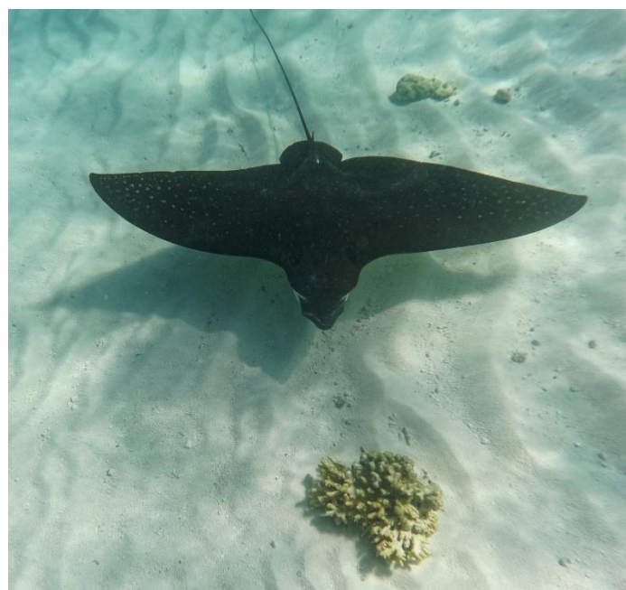
Foto oben: Mit guten Crews erlebt man persönliche Abenteuer. Hier: Adlerrochen mit bis zu 2,5 m Körperlänge und bis zu 230 kg Gewicht. Diese findet man in der BAJA CALIFORNIA in Mexiko.

der Crew Folge zu leisten und die Stimmung hochzuhalten. Halten sich alle an ihre „unsichtbaren Versprechen“, wird es mit Sicherheit ein gelungener Törn.