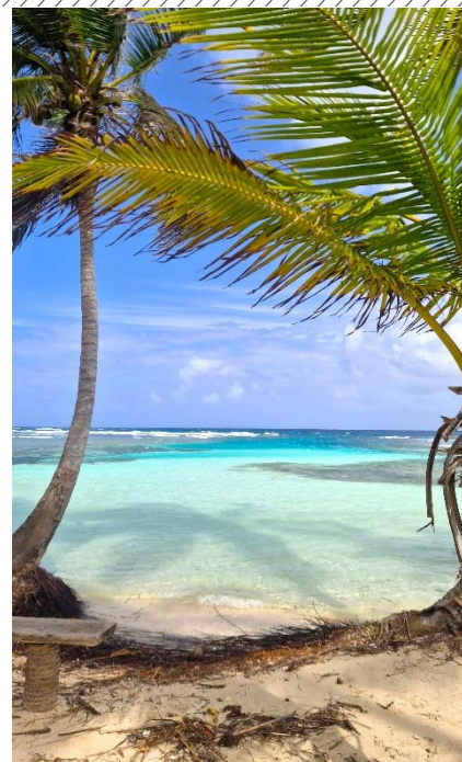
Foto rechts: Versprechen, dass der Segelurlaub problemlos abläuft.

Was wir erwarten, ist also abhängig von unseren bisherigen Erfahrungen, unserem Wissen, was wir glauben, und der Fähigkeit, sich damit eine Vorstellung zu machen, was auf uns zukommt.