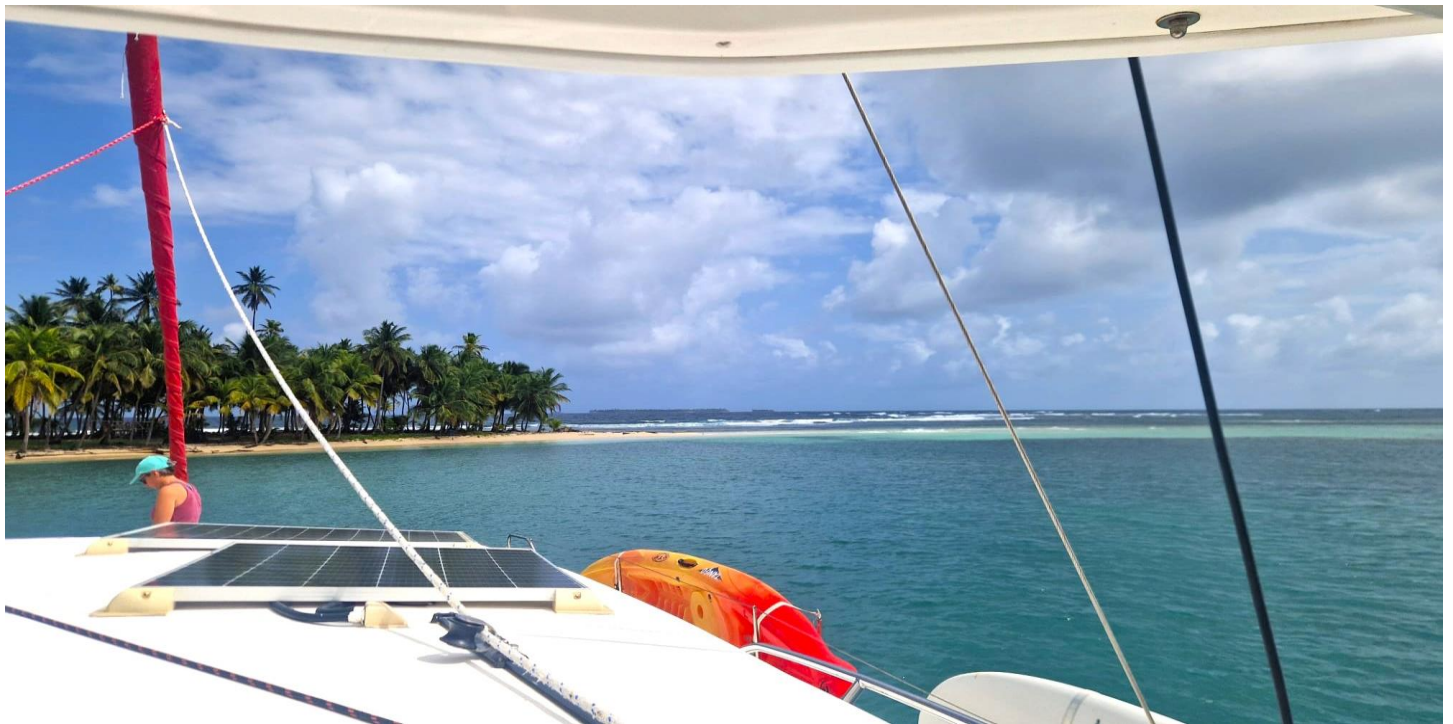
Foto oben: Einige der Zutaten für einen gelungenen Segeltörn sind entlegene Palmenbestandene Inseln, ein komfortables Boot und gutes Wetter.

ETWAS MEHR WIND UND WAS WIR UNS DAVON ERWARTEN