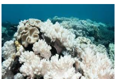
Fotos oben: Ehemals farbenfrohe Korallenriffe sind nun schneeweiß.

Ich segle und lebe seit über 30 Jahren auf See und nehme die Klimaveränderung mannigfaltig wahr, denn wir sind davon unmittelbar betroffen . Eine Erscheinung ist, dass wir manches Mal im Seegras (Sargassum) feststecken. Eine Folge der vermehrten CO 2 -Absorption der Ozeane und anderer Nährstoffeinträge wie Stickstoff und Phosphor. Umso erfreulicher ist, dass man Sargassum-Gras nun verwerten kann (siehe auch Flaschenpost 164 vom Dez. 2024). Die Universität auf Barbados entwickelte ein Verfahren, um mit Seegras CO 2 -neutralen Treibstoff herzustellen . Da diese Entwicklung aber keine Aufregung für die Medien ist, wird darüber kaum berichtet. Eine andere Auswirkung der Klimaveränderung ist, dass wir Korallenbleiche in der Karibik erleben.