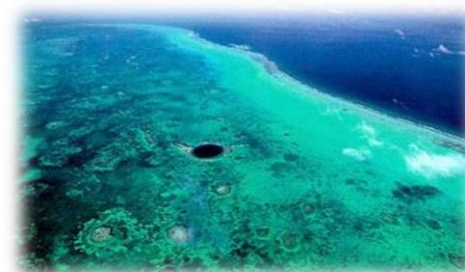
Foto oben: Great Blue Hole in Belize, eines der schönsten Atolle auf diesem Planeten

Dieser Törnvorschlagn wurde nach bestem Wissen ausgearbeitet. Der Schiffsführer kann den Törnverlauf auf Wunsch der Crew oder aufgrund von Umständen, die einen sicheren Törnverlauf erfordern, abändern. Die letzte Entscheidung, wie der Törn durchgeführt wird, liegt – so wie die Verantwortung – beim Schiffsführer.