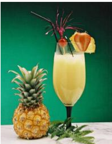
Foto links oben: Mit freundlicher Genehmigung von Günther Pribitzer

Spaß beim Tauchen und Wassersport hängt von der Reviererfahrung ab. Der Skipper hat mehr als 1200 Tauchgänge und kennt die Inseln wie seine Westentasche. Die Bord - Fee beherrscht das Schiffseigene Motorboot ebenso, wie die Machete (nur zum öffnen der Kokosnüsse). Wasserskifahren gehört – wenn gewünscht und erlaubt – auch zum Wassersportprogramm auf dem Katamaran.